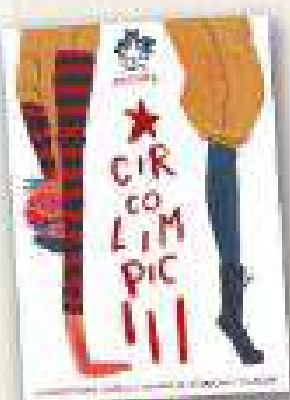
COSAS DE DOS

16:45 h. a 18:45 h. En la Plaza de España, BUBBLE SOCCER para todos los niños. Juega al fútbol dentro de una burbuja.